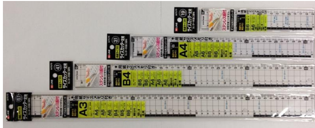
【不具合品】 ※定規端部ステンレス板が浮いている